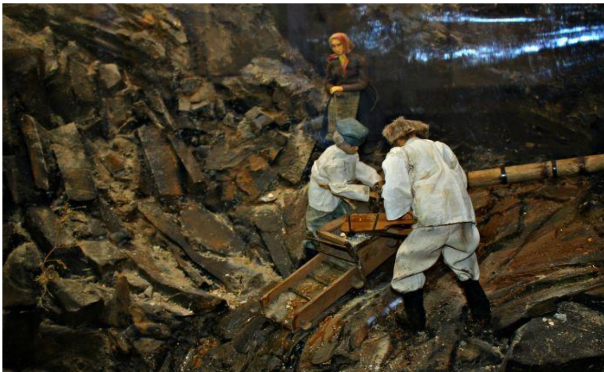
3) Добыча рудного золота. Фрагмент музейной экспозиции в г. Берёзовском.

9.1. Наш край богат различными полезными ископаемыми. Жизнь и труд их добытчиков в XIX – начале XX вв. описывали в своих произведениях уральские авторы. Установите соответствие между фрагментами сказов П.П. Бажова и фотографиями, связанными с добычей полезных ископаемых.