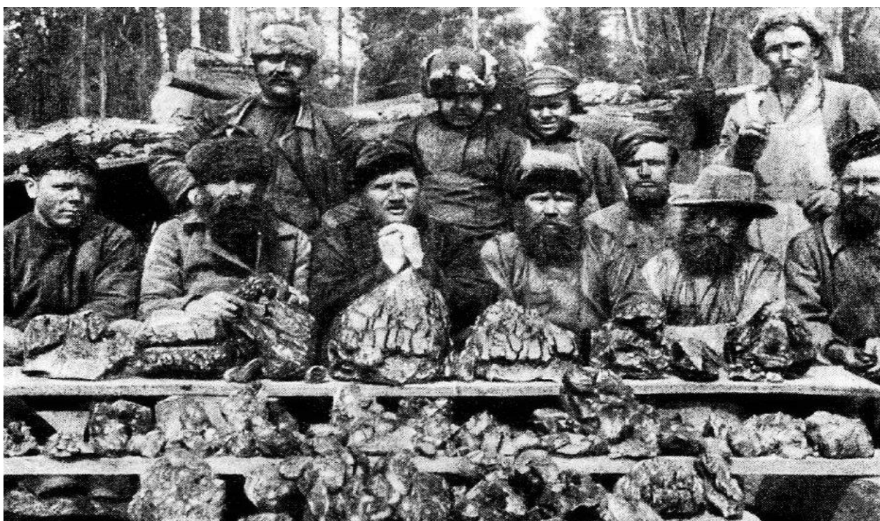
2) Горщики с добытыми самоцветами. Адуй.