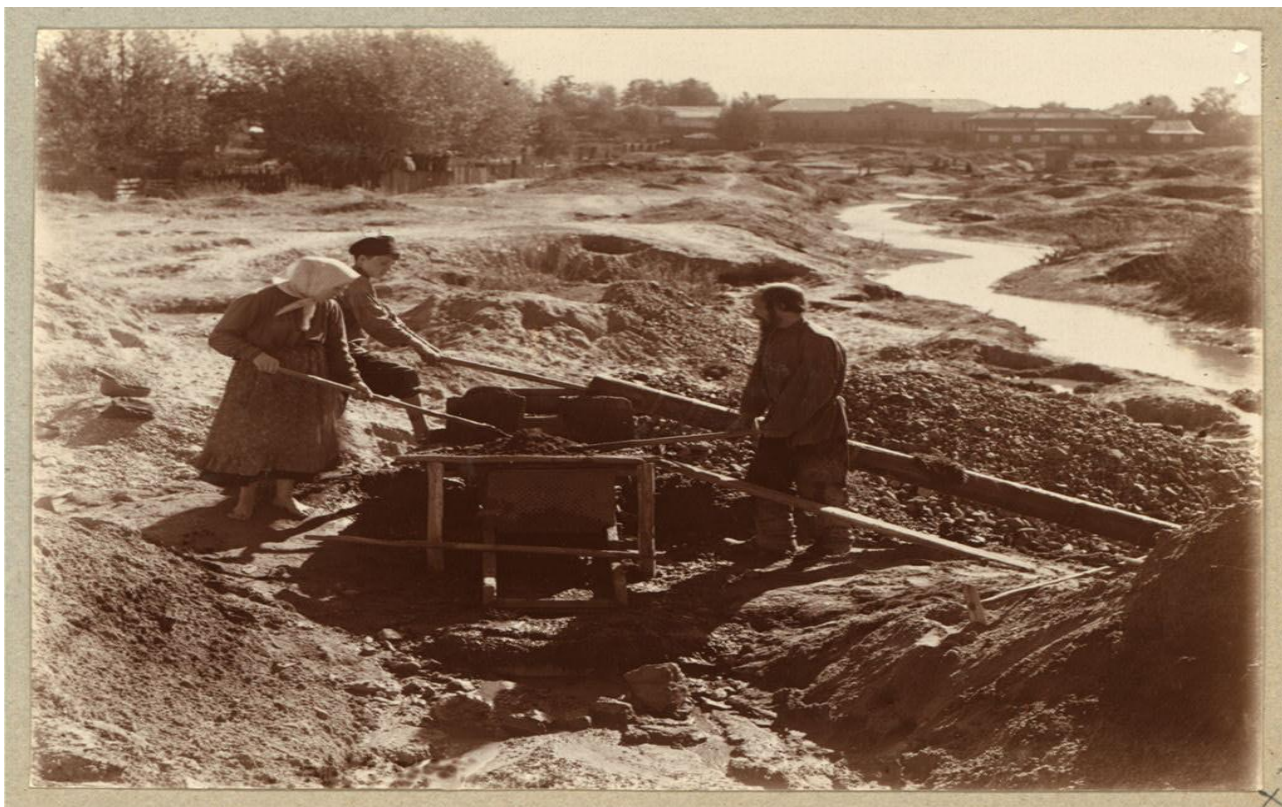
1) Промывка старателями золотоносного песка. Берёзовские прииски.